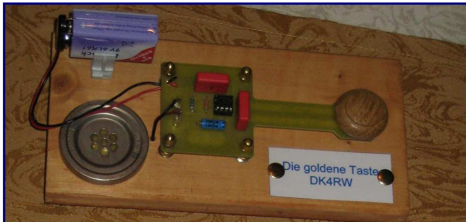
Abbildung 4: Goldene Morsetaste

Wolfgang, DK4RW, erhielt von Klaus-Dieter, DJ7JE, für aktive Teilnahme an der Waldsassen-Runde auf 3,568 MHz die Goldene Morsetaste.