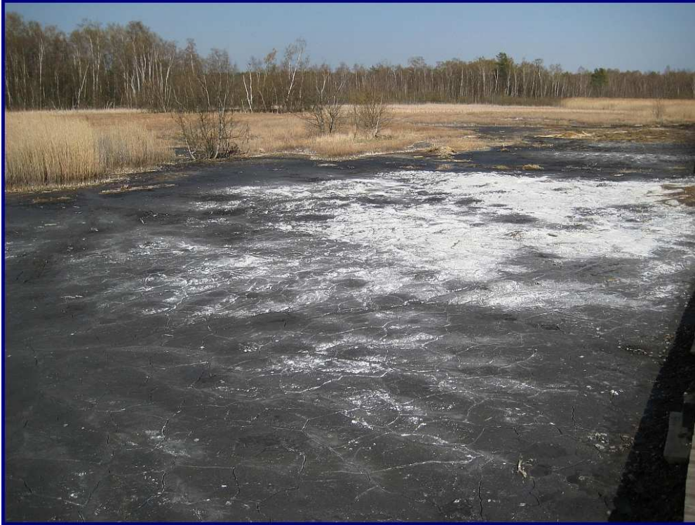
Abbildung 8: Naturschutz- gebiet Soos

Die yls/xyls hatten ihr eigenes Programm. Sie fuhren am Samstag nach Franzensbad und in das Naturschutzgebiet Soos mit einzigartigen Mineral- und CO 2 -Quellen. Diese Tour wiederholte ich mit meiner xyl am späten Sonntag-Nachmittag: