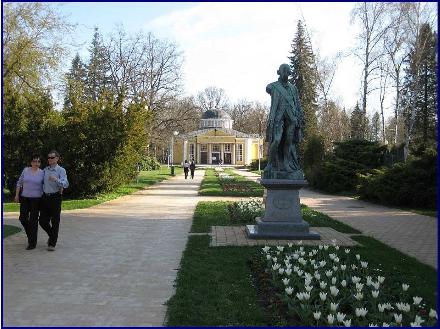
Abbildung 9: Franzensbad